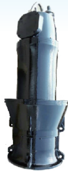
• 潜水轴流泵 JPP型