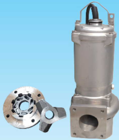
• 潜水割刀泵 JPH型