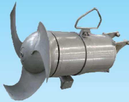
• 潜水搅拌器 JPX型