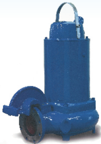
• 油冷却潜水泵 JPSH型